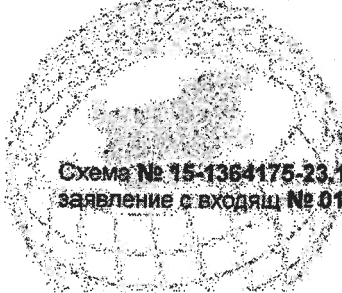
Схема № 15-1364175-23.11.2022 г. издадена въз основа на заявление с входящ № 01-666759-15.11.2022 г.

Нотариален акт № 51 том 10 рег. 3427 дело 1918 от 26.03.2022г., издаден от СЛУЖБА ПО ВПИСВАНИЯТА-РУСЕ